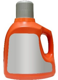
Figura 4